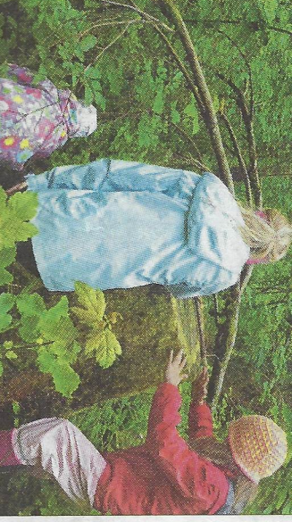
Kinder und Jugendliche lieben es, recht abenteuerlich durch den Wald zu streifen.