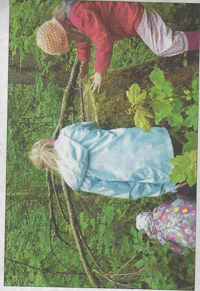
Kinder und Jugendliche lieben es, recht abenteuerlich durch den Wald zu streifen.

Beim Bayrischen Fernse-hen kann auf der Media-thek das Interview von