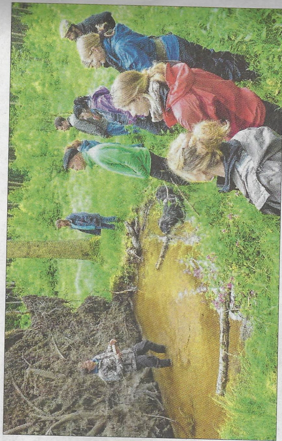
Bei einer Exkursion erlebt man so allerhand und lernt vieles über die Natur.

Alle Kurse für ein Zertifikat Diese Kurse können sowohl einzeln als Kursmodul oder als Gesamtpaket ge-bucht werden. Für eine umfassende Aus-bildung und für das Zertifikat zum Na-turpädagogen wäre natürlich die Teil-nahme an allen Kursen Voraussetzung.