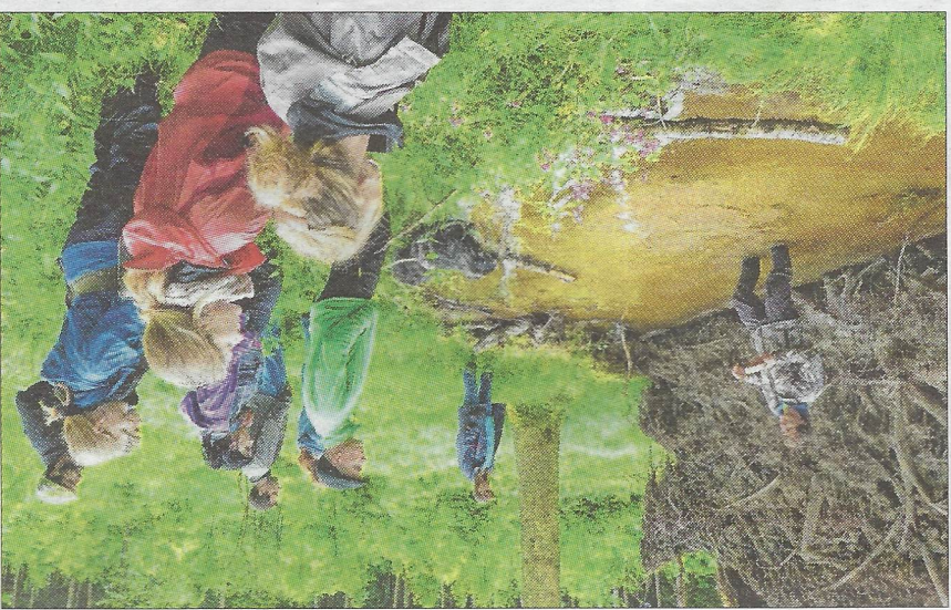
Bei einer Exkursion erlebt man so allerhand und lernt vieles über die Natur.