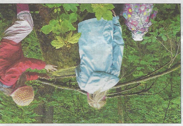
Kinder und Jugendliche lieben es, recht abenteuerlich durch den Wald zu streifen.