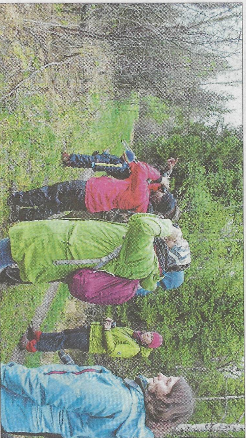
Auf Vogel-Exkursion: Dazu geht es meistens ins Wurzacher Ried - denn hier gibt es besondere und seltene Arten.

vogelwelt und vogelsammeln: vögel erkennen und beobachten, Federkunde, Vogel-Exkursion ins Wurzacher Ried Bäume und Sträucher: Bestimmungsrübungen, Anwendung und Gebrauch der Holzarten, Waldökologie, Wildkräuter: Bestimmungsrübungen, Kochen mit Kräutern, Kräutertees